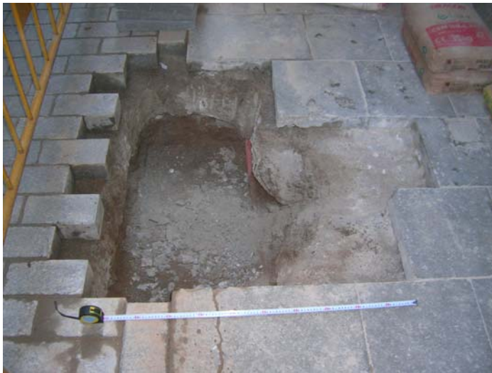
Procés de cobriment

Finalment, un cop acabades les tasques, i degut a que no es van trobar cap tipus de restes arqueològiques, es va procedir al cobriment de la rasa amb les mateixes graves que es van extreure durant la intervenció i a la recol·locació de les lloses del paviment.