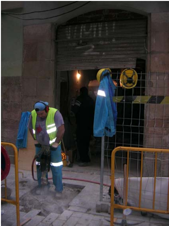
Desenvolupament dels treballs efectuats per l'Unitat Operativa de Sanejament de l'Ajuntament de Barcelona