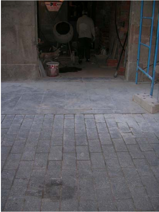
Nivell actual de circulació format per lloses de diferents mides. UE 1