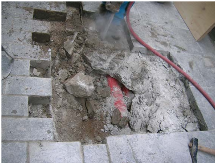
Detall del paviment del carrer i la seva preparació de formigó (UE 1 i UE 2)

Un cop aixecat el paviment es va poder documentar un nivell de formigó (UE 2) d'uns 0,40m de potència, que actua com a preparació del paviment del carrer.