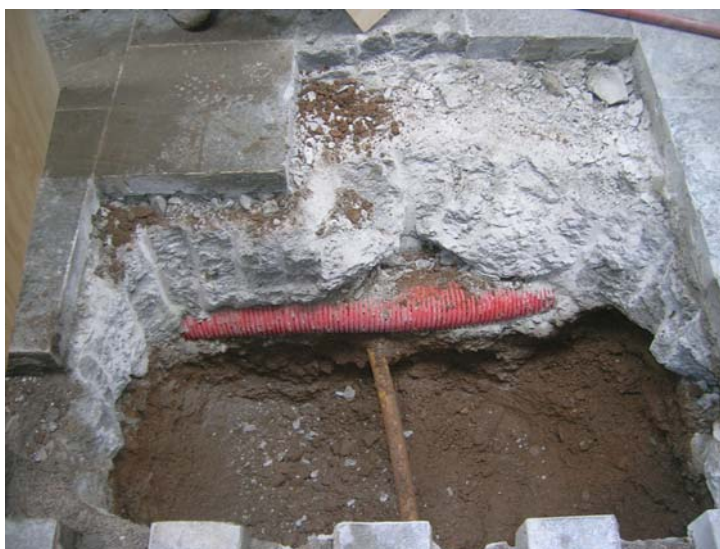
Procés d'excavació de del rasa, detall del nivell de grava documentat (UE 4)

Per sota d'aquest nivell de formigó s'ha localitzat un nivell de grava (UE 4) poc compactades, humides i de color marró fosc i una sèrie de tubs destinats al servei de llum i gas de la zona.