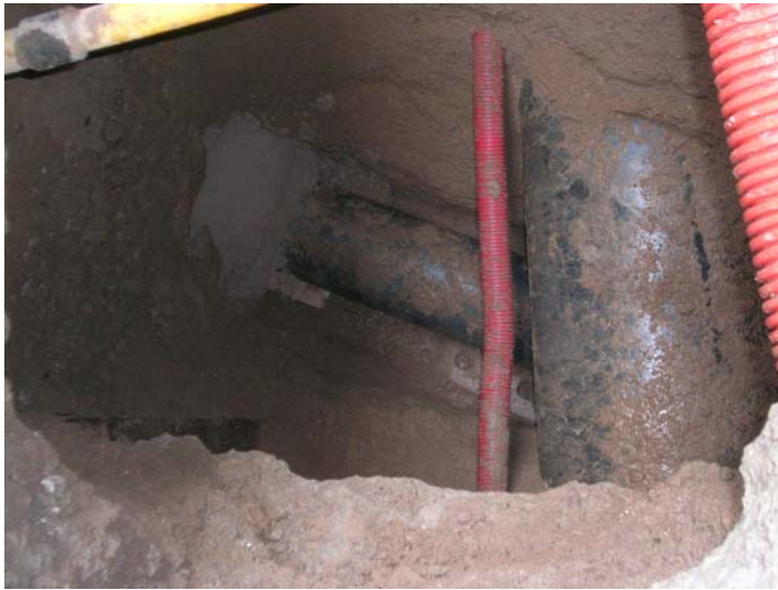
Procés final d'instal·lació del clavoguero.

Finalment, un cop acabades les tasques, i degut a que no es van trobar cap tipus de restes arqueològiques, es va procedir al cobriment de la rasa amb les mateixes graves que es van extreure durant la intervenció i a la recol·locació de les lloses del paviment.