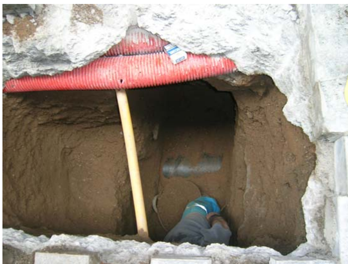
Procés d'excavació de del rasa, detall del tub de recollida de brossa pneumàtica

De fet, aquest conducte també va poder ser documentat a la citada cota de 2,10m de profunditat respecte al nivell actual de circulació (UE 1). Això va provocar que s'hagués de rebaixar un metre més el nivell de graves (UE 4), fins arribar a una cota de 3,10m, (12m.s.n.m) per poder instal·lar el tub del clavegueró.