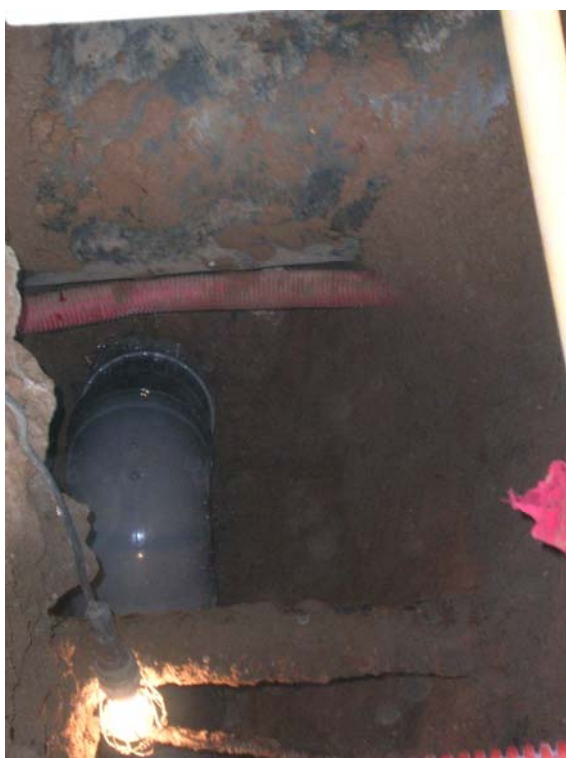
Procés d'instal·lació del clavegueró.