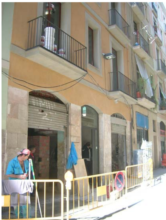
Façana principal de la finca situada al carrer Lleó número 5

Les tasques desenvolupades durant aquest seguiment arqueològic s'han centrat en el control dels rebaixos efectuats al subsòl de forma manual per l'Unitat Operativa de Sanejament de l'Ajuntament de Barcelona al davant de la finca del carrer Lleó número 5.