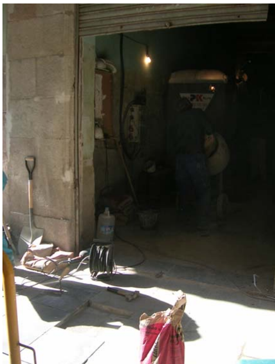
Procés de recol·locació de les lloses del paviment.